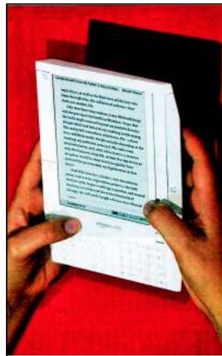
A Kindle az olvasó kezében

Először pár szót a digitális médium által bedobott – németül – Hörbuch -ról, ami magyarul hallgani való könyvet jelentene: egy könyv CD-n (általában kitűnő dikcióval rendelkező személyek olvassák rá a szöveget), tehát nem olvasni, hanem hallgatni kell ill. lehet. Én ezt kulturális atavizmusnak 6 nevezném, amit két tényező összejárása tett lehetővé: a könyvnél olcsóbb előállíthatóság mellett a nagy tömegek szellemi és kulturális lerongyolódásának ténye, ami döntő módon a tv-adók által terjesztett amerikanizálás egyik eredménye. Azért atavizmus, mivel tudjuk, hogy hajdan a felolvasó – ami új foglalkozás volt! – kézzel írott, egyedi példányú könyvekből tartott felolvasása révén szerzett tudomást egy-egy könyvben leírt dolgokról az, aki ezt magának megengedhette. 7 Érdekes módon