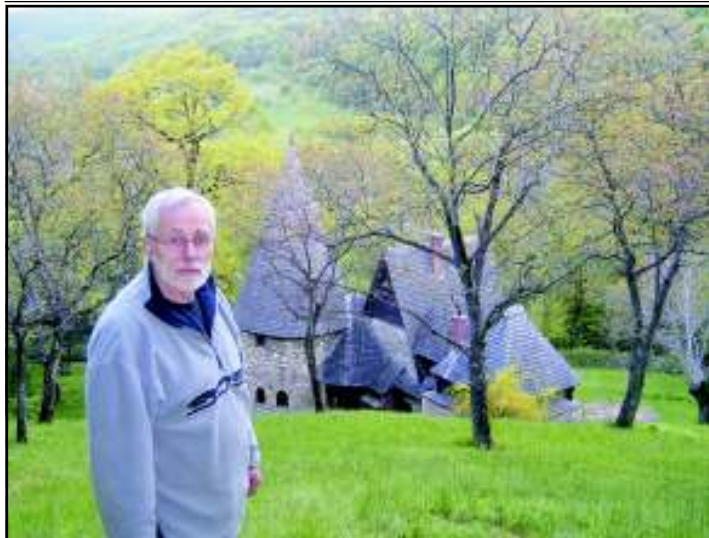
Béla és a Varjúvár